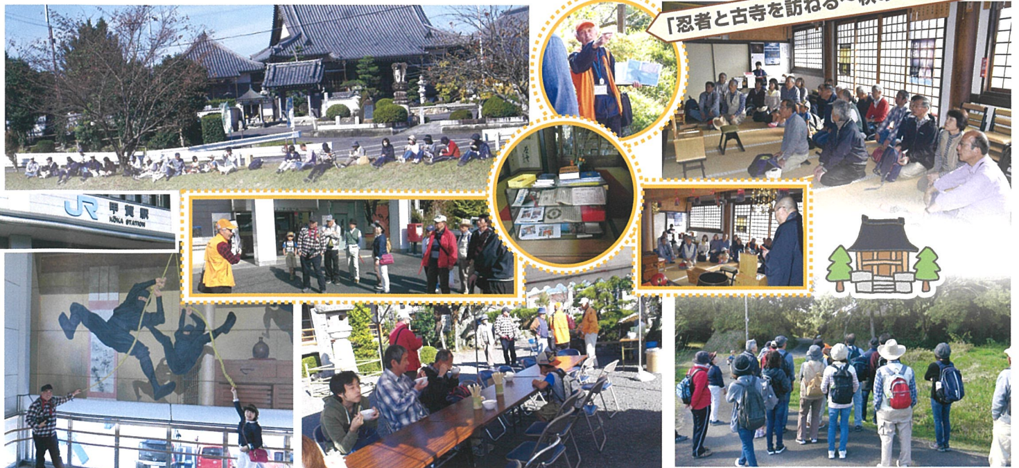
「忍者と古寺を訪ねる～秋の甲賀路散策」

11月10日(日)宮ファミリーウォークを実施しました。当日の参加者は23名で行先は、忍古寺を訪ね甲賀町田堵野・滝方面へ、地元のボランティアガイドさんの案内で秋の甲賀路を散策しました。改めて素晴らしい歴史の地を実感できた楽しい一日でした。