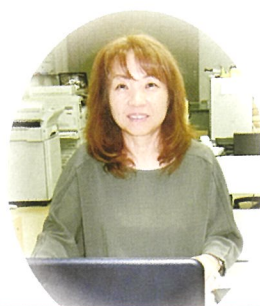
八里地域マネージャー

宮地区の集落排水事業でお世話になって以来、26年ぶりのご当地となります。時の流れを感じつつ懐かしい思いの中で日々仕事をしております。前回同様、地域のために精一杯頑張りますのでよろしくお願いいたします。