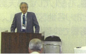
宮地区自治振興会総会

最後に、宮の歴史文化を調査し記録にとどめる「歴史文化調査事業」やそのための基金造成および地域おこし協力隊受け入れに関する取組などの新規事業をはじめとする平成二十七年事業計画および予算案の説明を事務局長および会計が行い、両議案とも総会の承認を受けて議事を終了しました。