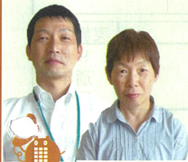
甲南第三地域市民センター 野川簡易郵便局 電話 86-8518

甲南第三地域市民センター便り 地域市民センターでは、自治振興会を中心とした地域のまちづくり支援や区、自治会、さらには市民の皆様からのご意見・ご相談に対応させていただき、きめ細やかな行政サービスの提供と市民の皆様に関心される親切丁寧な対応を目指していきます。 住民票・戸籍・印鑑証明書等の発行や市の税金・料金のお支払いなど、身近な市役所としてお気軽にご利用ください。 甲南第三地域市民センターでは、七月一日より「JAこうか」から野川簡易郵便局の運営を引き継ぐことになりました。お取扱内容は、今までと変わりなくご利用いただけます。 切手・はがき・印紙の販売、ゆうパックの受付、書留、振替払込ができません。 お取扱時間は、 九：00～一六：00迄です。 お気軽にご利用ください。