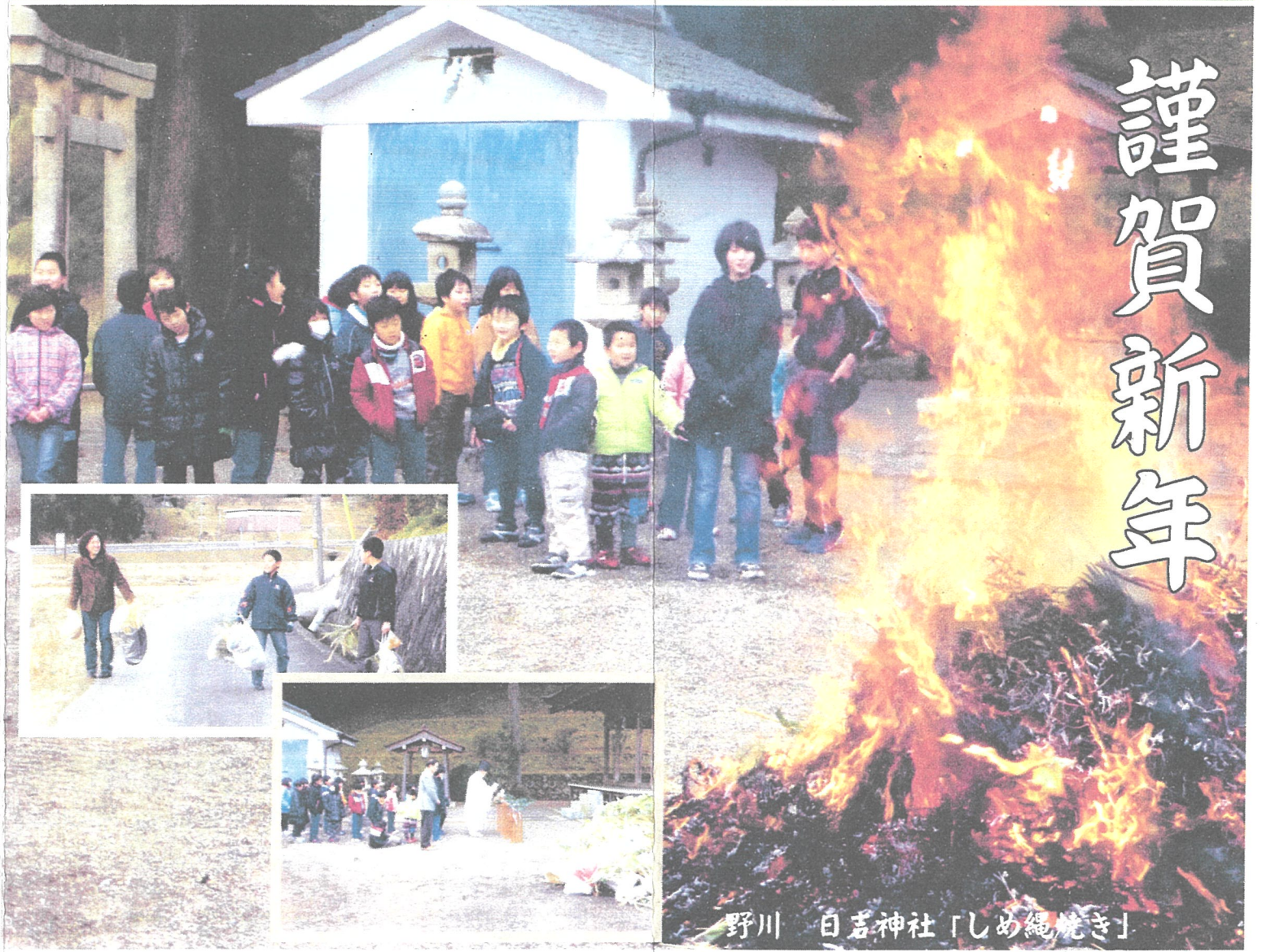
野川 白岩神社「しめ縄焼き」