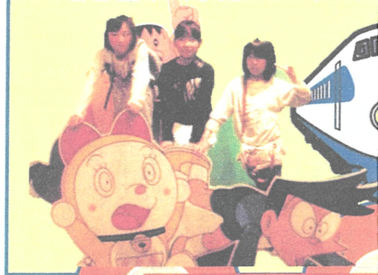
◎子供会研修旅行(5日) 名古屋市科学館 & JR リニア