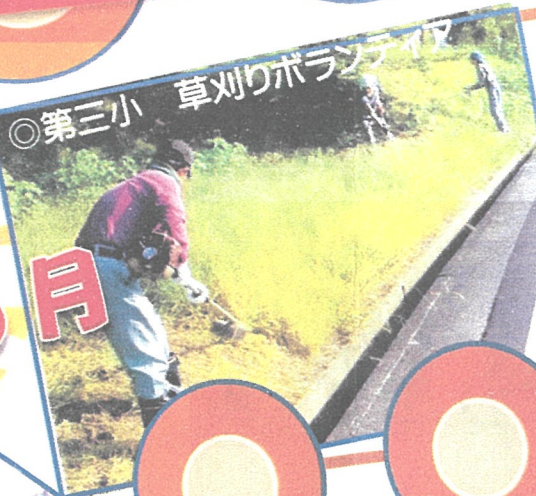
◎第三小 草刈りボランティア