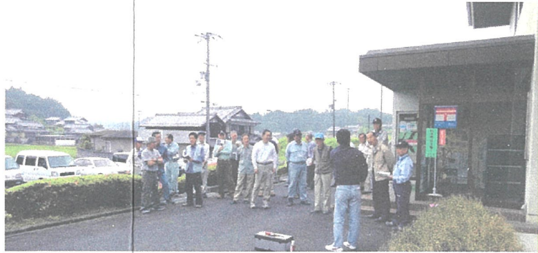
サルの追い払い隊研修の様子