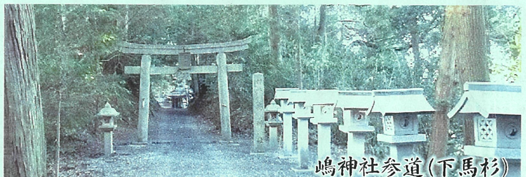
嶋神社参道(下馬杉)