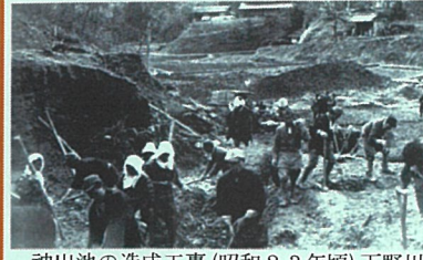
神出池の造成工事(昭和23年頃)下野川

このほかに、祖先に対する日頃の感謝や学理が進んだとしても、人の力ではどうにもならない自然の威力などを通して数々の経験が立派な精神力を有するに至ったのではないかと描かれています。 そして、この精神力が産業や自治、教育、その他あらゆる方面に繋がって模範村宮村を建設するに至っています。 私たちもこの宮村の精神をもう一度お互いが確認しながら、新しいまちづくりに向かつて取り組みたいと考えています。皆さんのご協力よろしくお願います。